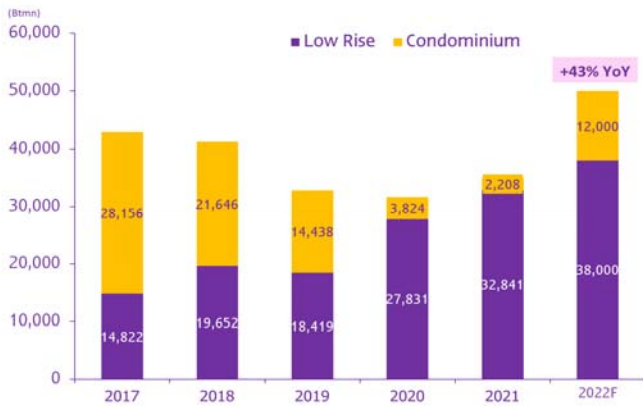
Figure 1: Presales (Year) 2017-2022F