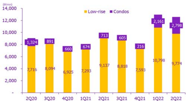
Figure 3: Quarterly presales 2Q20-2Q22, condos picked up YoY and QoQ