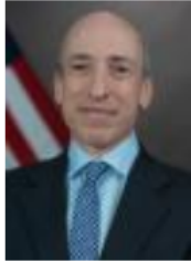
Chair Gary Gensler